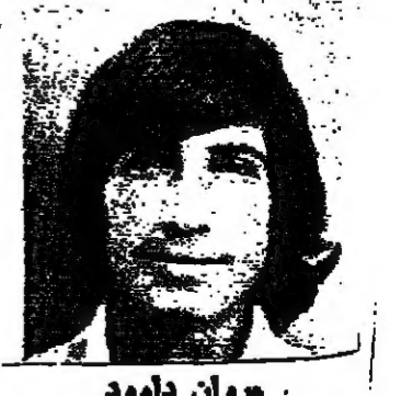
لحز هدف مكابي القريديس